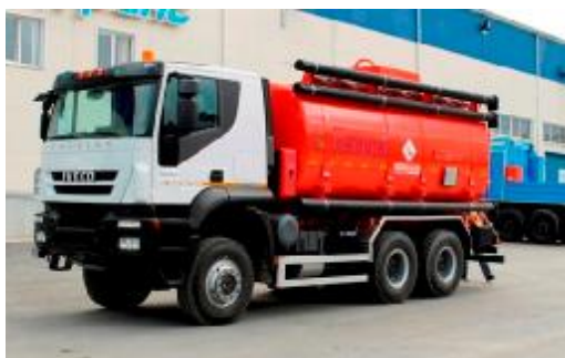
Рисунок 1 – с одним отсеком

Внешний вид АТЗ представлен на рисунке 1, 2, 3, 4 Место пломбирования обозначено на рисунке 5, 6 и 7.