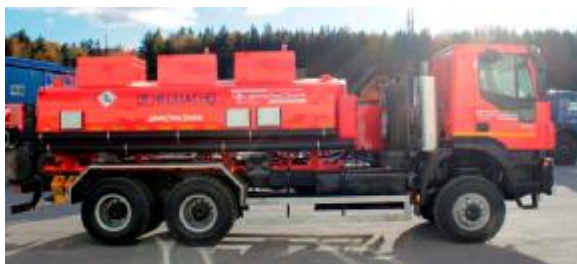
Рисунок 3 – с тремя отсеками