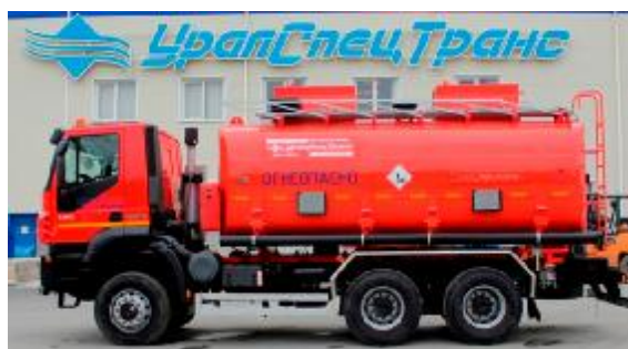
Рисунок 2 – с двумя отсеками