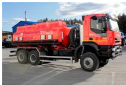
Рисунок 4 – с четырьмя отсеками