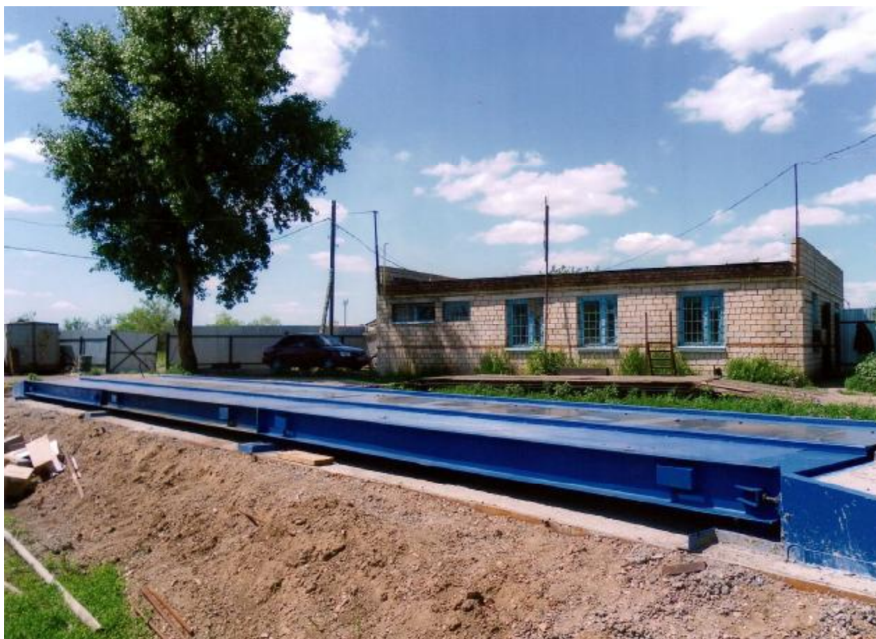
Рисунок 1 - Внешний вид грузоприемной платформы весов «Яик»

Принцип действия весов заключается в преобразовании упругой деформации элементов тензорезисторных весоизмерительных датчиков, возникающей под действием силы тяжести взвешиваемого груза, в электрический сигнал, изменяющийся пропорционально этой силе. Аналоговые электрические сигналы с датчиков суммируются и поступают в блок весоизмерительного прибора, где суммарный сигнал преобразуется в цифровой код. Значение массы груза отображается на цифровом табло весоизмерительного прибора. В состав весов дополнительно может входить программно-аппаратный комплекс, предназначенный для отображения, сохранения и печати результатов измерений массы. Внешний вид грузоприемной платформы весов приведен на рисунке 1.