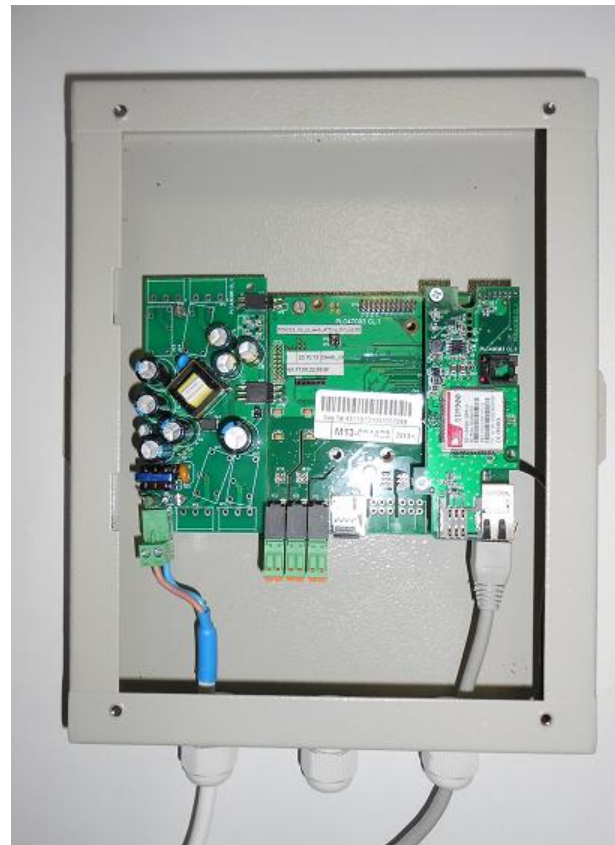
Рисунок 2 Общий вид КМ ЭНТЕК E1R2-G-P-02 без крышки