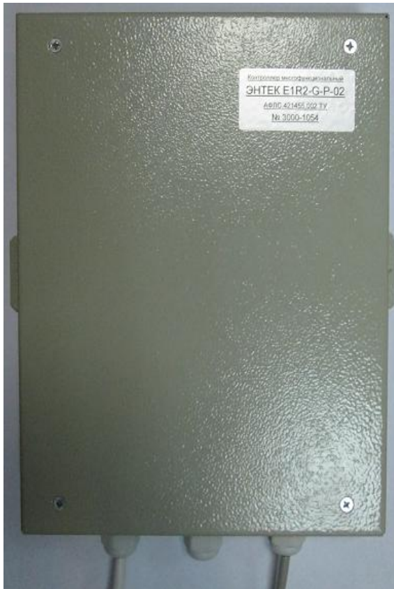
Рисунок 1 Общий вид КМ ЭНТЕК E1R2-G-P-02

Фотографии общего вида КМ ЭНТЕК E1R2-G-P-02 приведены на рисунках 1, 2