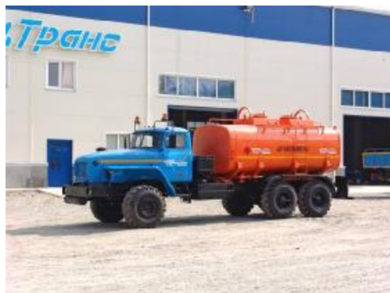
Рисунок 2 - С двумя отсеками