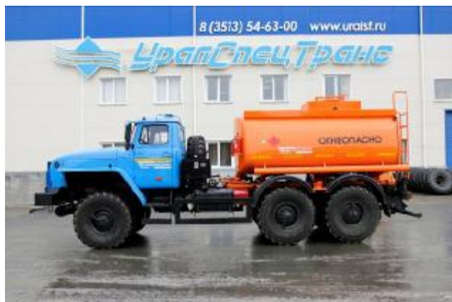
Рисунок 1 - С одним отсеком

Внешний вид АТЗ представлен на рисунке 1, 2, 3, 4. Место пломбирования обозначено на рисунке 5, 6 и 7.