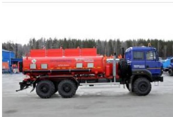
Рисунок 4 - С четырьмя отсеками