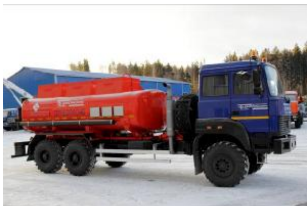
Рисунок 3 - С тремя отсеками