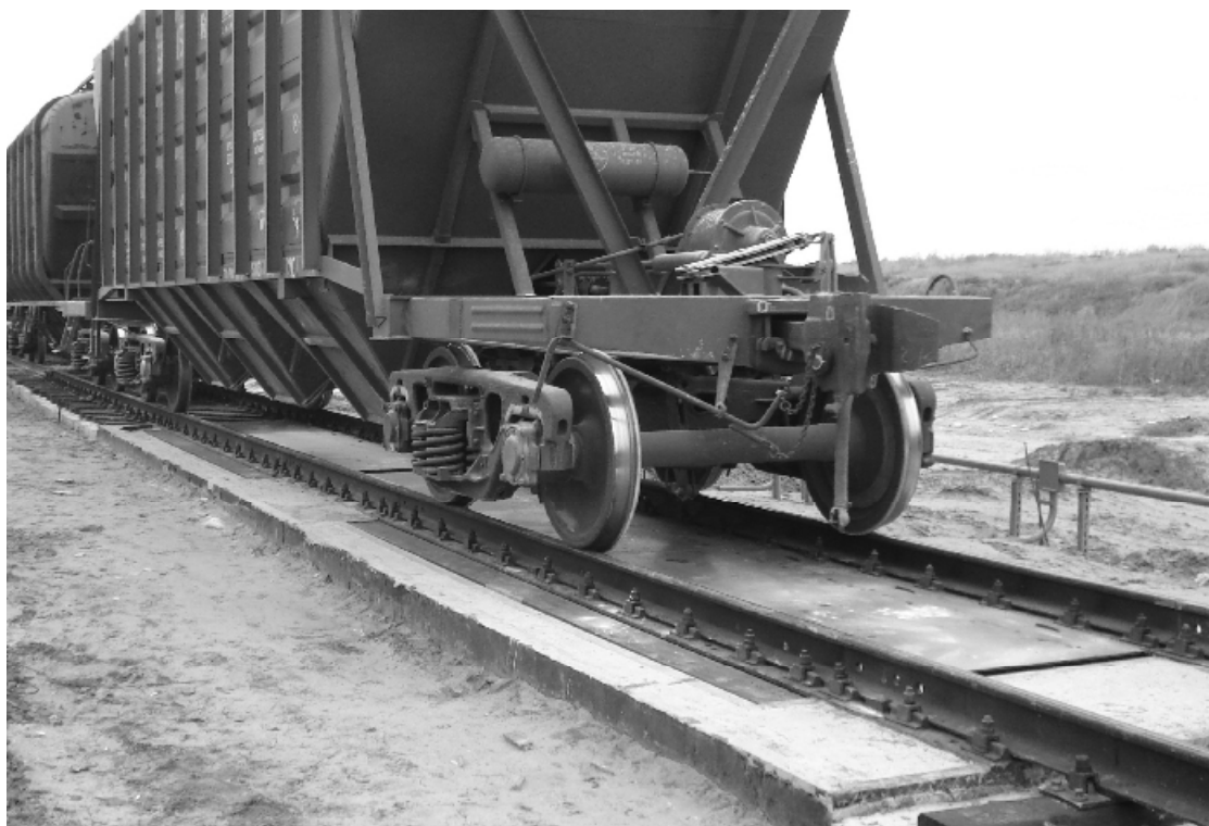
Рисунок 1 - Общий вид ГПУ весов

Сигнальные кабели датчиков подключены к электронному весоизмерительному устройству через клеммную и распределительную коробки.