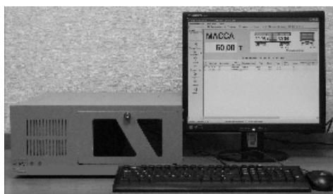
Рисунок 2 - Общий вид индикатора М1РС-01 и терминала М1РС-03