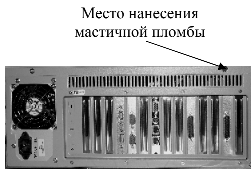
Рисунок 4 - Схема пломбировки индикатора М1РС-01 и терминала М1РС-03