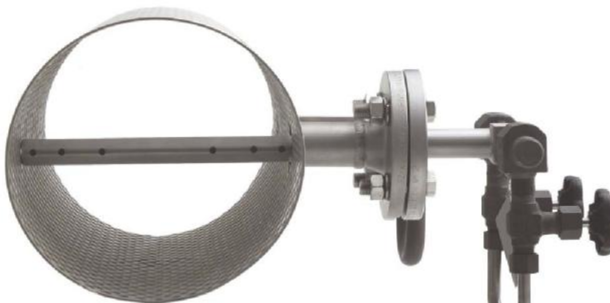
Рисунок 1–Внешний вид преобразователя расхода измерительного SDF

Внешний вид преобразователя показан на рисунке 1.