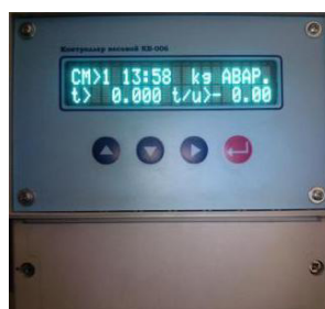
Рисунок 2 – Контроллер весовой KB-006

Принцип действия весов основан на преобразовании деформации упругого элемента датчика, возникающей под действием силы тяжести пропускаемого через конвейерные весы материала, в аналоговый электрический сигнал, пропорциональный линейной плотности транспортируемого по конвейерной ленте материала. Далее этот сигнал и сигнал с ДС поступают в электронное весоизмерительное устройство (суммирующее устройство), где обрабатываются значения производительности весов, линейной плотности материала, скорости конвейерной ленты и суммарной массы материала, взвешенного на весах, выводится на дисплей весоизмерительного устройства.