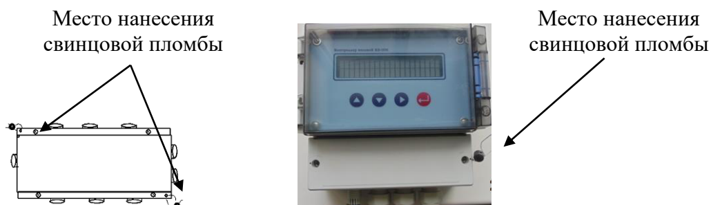
Рисунок 3 – Схема пломбировки корпуса соединительной коробки (слева) и КВ-006 (справа)

Схемы пломбировки от несанкционированного доступа приведены на рисунке 3.