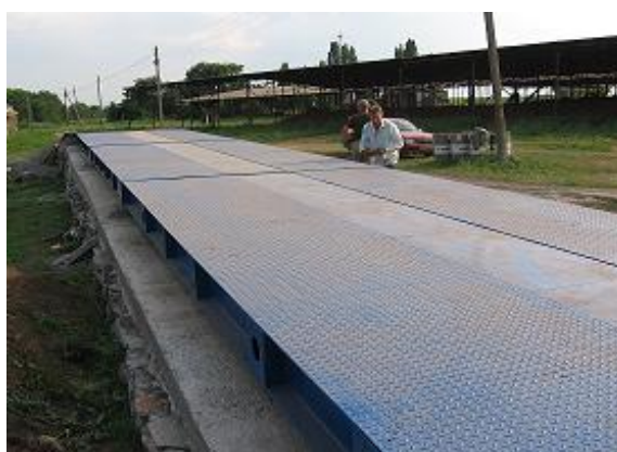
Рисунок 2 Внешний вид весов автомобильных электронных ДОН-СВАП