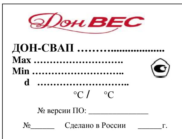
Рисунок 3 Маркировка весов автомобильных электронных ДОН-СВАП

Маркировка весов производится на планке, закрепленной и опломбированной на задней поверхности корпуса индикатора, на каждой грузоприемной платформе, на которой нанесено: