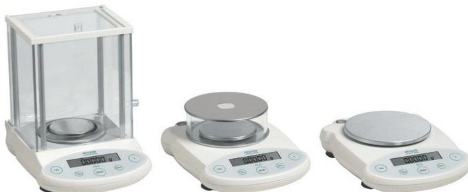
Рисунок 1 - Общий вид весов неавтоматического действия ACCULAB ALC.

Принцип действия весов модификаций ACCULAB ALC-150d3, ACCULAB ALC-2100d2, ACCULAB ALC-210d4, ACCULAB ALC-3100d2, ACCULAB ALC-320d3, ACCULAB ALC-80d4 основан на компенсации массы взвешиваемого груза электромагнитной силой, создаваемой системой автоматического уравнивания.