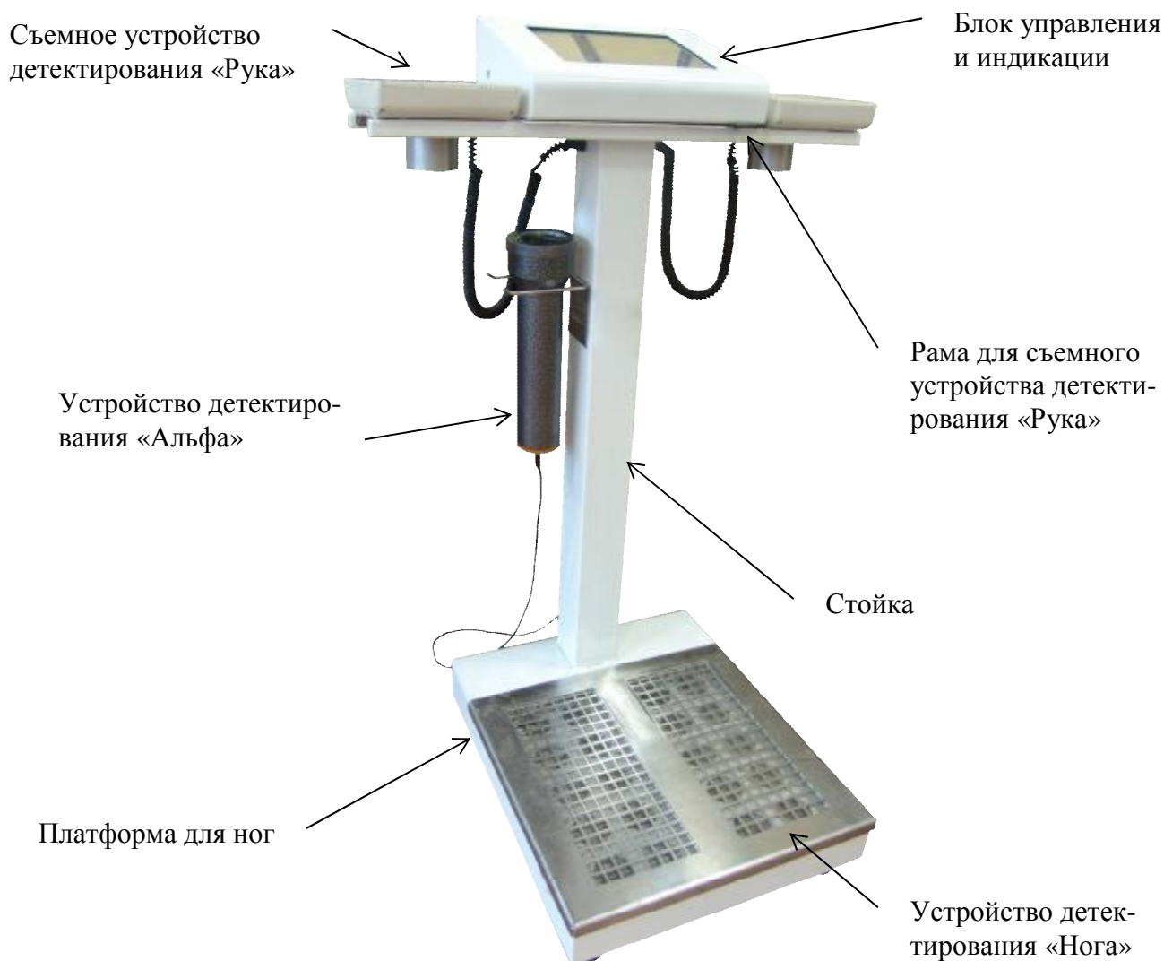
Рисунок 1.1 – Внешний вид установки МКС-100А «Чистотел»

Общий вид установки МКС-100А «Чистотел» представлен на Рисунке 1.