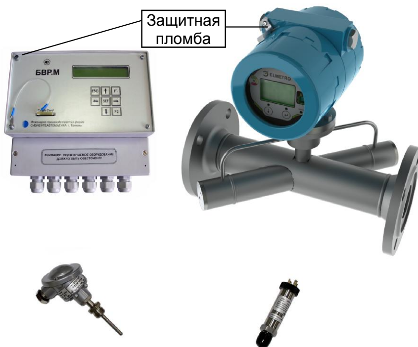
Рисунок 1 — Счётчик газа ультразвуковой СГУ.1