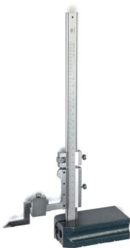
Рисунок 1 – Общий вид штангенрейсмасов серий 609 и 609 А