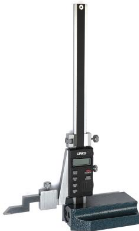
Рисунок 2 – Общий вид штангенрейсмасов серии 611