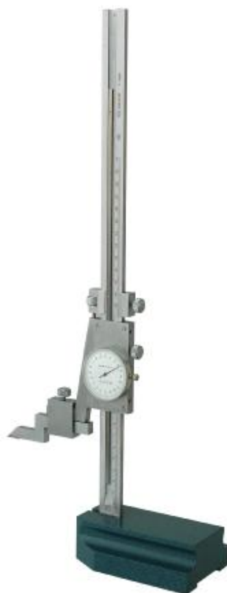
Рисунок 3 – Общий вид штангенрейсмасов серии 617