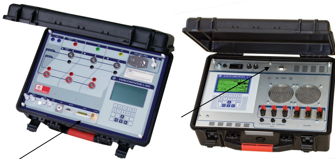
Рисунок 2 - Общий вид Установки "УППУ-МЭ 3.1КМ-П"