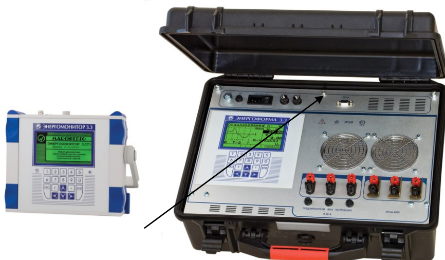
Рисунок 3 - Общий вид Установки "УППУ-МЭ 3.3Т1-П"

(Клеймение переносных установок после поверки производится в виде оттиска клейма поверителя на крепежных винтах в местах, указанных стрелками).