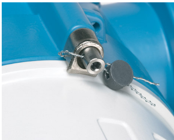
Рисунок 2 – Опломбирование корпуса электронного преобразователя.