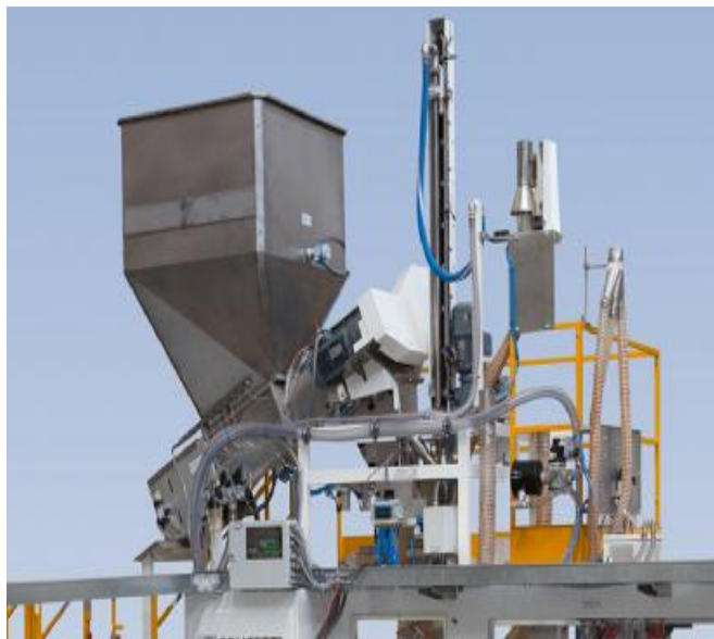
Рисунок 1.1 – Модификация с НПД до 60 кг