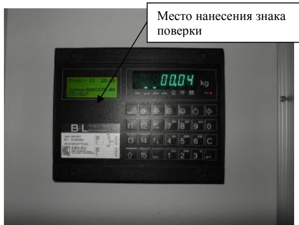
Рисунок 3.1- лицевая панель прибора SWA 2000 С весовое устройство