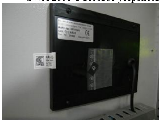
Рисунок 3.3- Дисплей (наклейка)