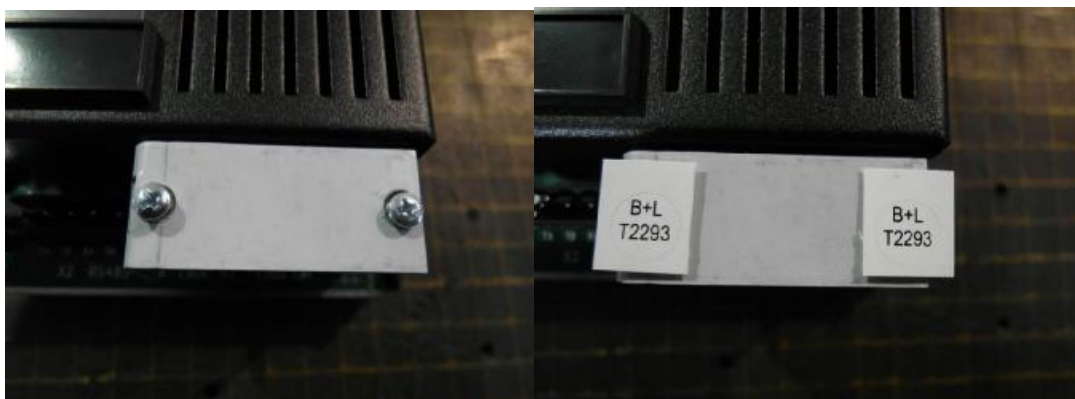
Рисунок 3.5 – Последовательность монтажа калибровочной перемычки на весоизмерительном приборе в месте подключения весоизмерительных датчиков Рисунок 3 –Пломбировка от несанкционированного доступа