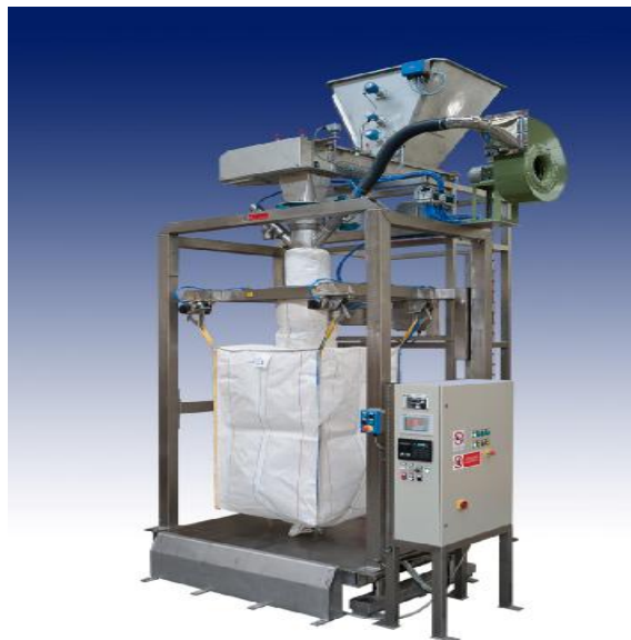
Рисунок 1.2 - Модификация с НПД до 2000 кг