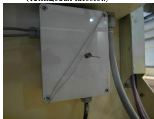
Рисунок 3.4 – Соединительная коробка (свинцовая пломба)