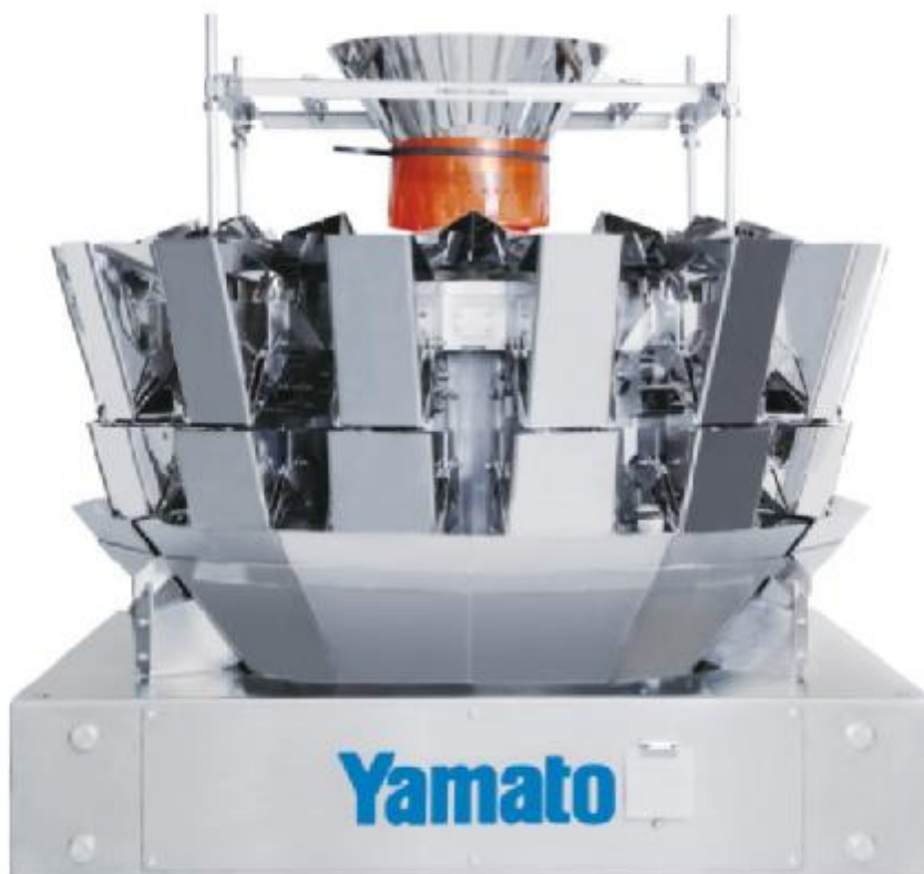
Рисунок 1 – Общий вид дозаторов

Общий вид дозаторов представлен на рисунке 1.