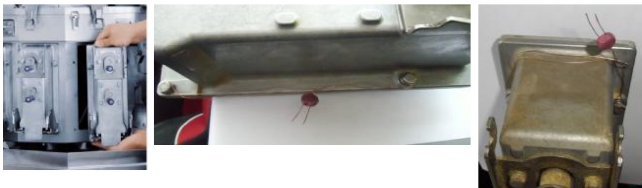
Рис. 3 – Пломбировка весоизмерительных бункеров (свинцовая пломба)

Схема пломбировки от несанкционированного доступа приведена на рисунках 3 - 4.