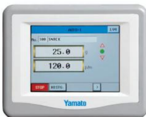
Рисунок 2 – Внешний вид контроллера RCU-901C

Принцип действия дозаторов основан на преобразовании деформации упругих элементов тензорезисторных датчиков, возникающей под действием силы тяжести дозируемого материала, в аналоговый электрический сигнал, изменяющийся пропорционально массе дозируемого материала. Далее аналоговый электрический сигнал с датчиков поступает в контроллер, где сигнал обрабатывается, и информация о массе дозируемого материала передается в терминал. Терминал выполняет функцию управления процессом загрузки материала в промежуточные бункеры, рассчитывает возможные комбинации по данным о массе продукта в каждом весоизмерительном бункере, находит и выбирает комбинацию, наиболее близкую к заданному номинальному значению массы дозы. С помощью терминала осуществляется автоматическое управление процессом дозирования, аварийная остановка, а также настройка следующих режимов работы дозаторов: