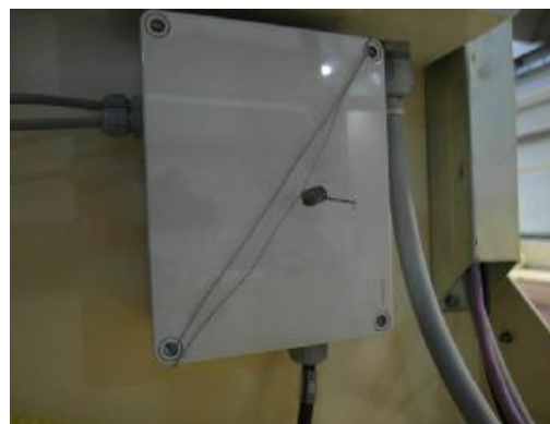
Рисунок 3.4 – Соединительная коробка (свинцовая пломба)