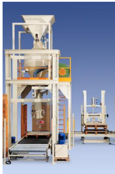
Рисунок 1.1 – Модификация с НПД до 60 кг