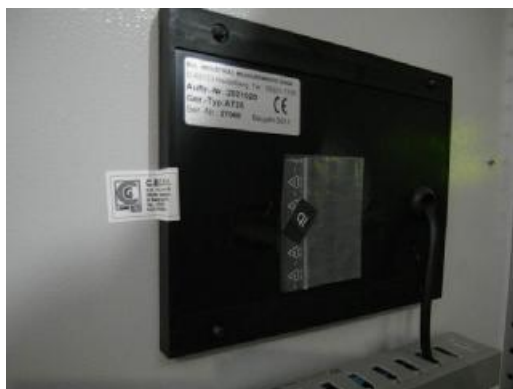
Рисунок 3.3- Дисплей (наклейка)