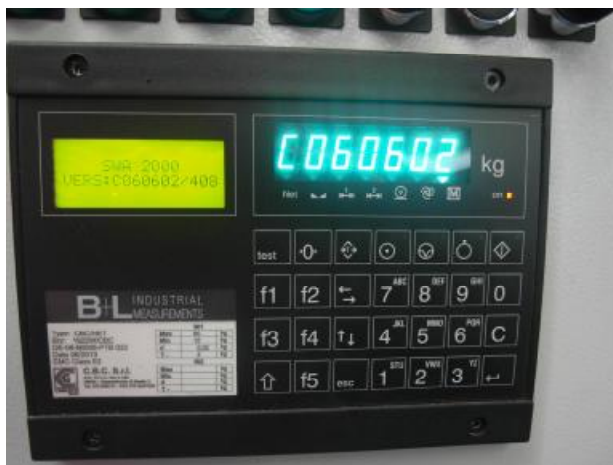
Рисунок 2- Внешний вид прибора SWA 2000 С

Принцип действия дозаторов основан на преобразовании деформации упругих элементов тензорезисторных датчиков, возникающей под действием силы тяжести дозируемого материала, в аналоговый электрический сигнал, изменяющийся пропорционально массе дозируемого материала. Далее аналоговый электрический сигнал с датчиков поступает на весоизмерительный прибор, в котором сигнал обрабатывается, и информация о массе дозируемого материала индицируется на цифровом табло.