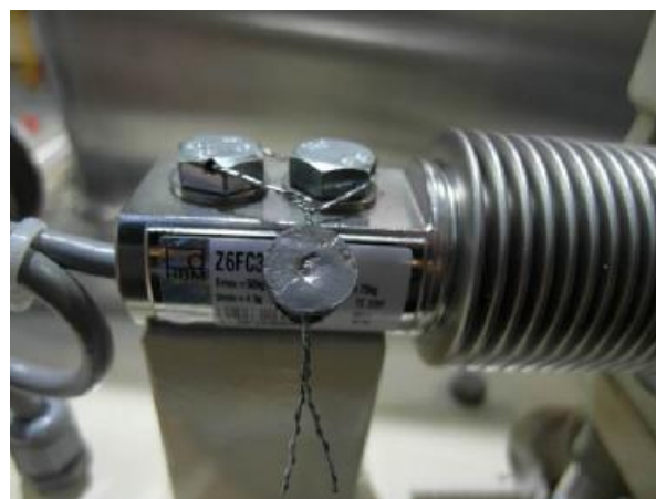
Рисунок 3.2 – Весоизмерительный датчик (свинцовая пломба)