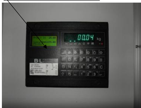
Рисунок 3.1- лицевая панель прибора SWA 2000 С