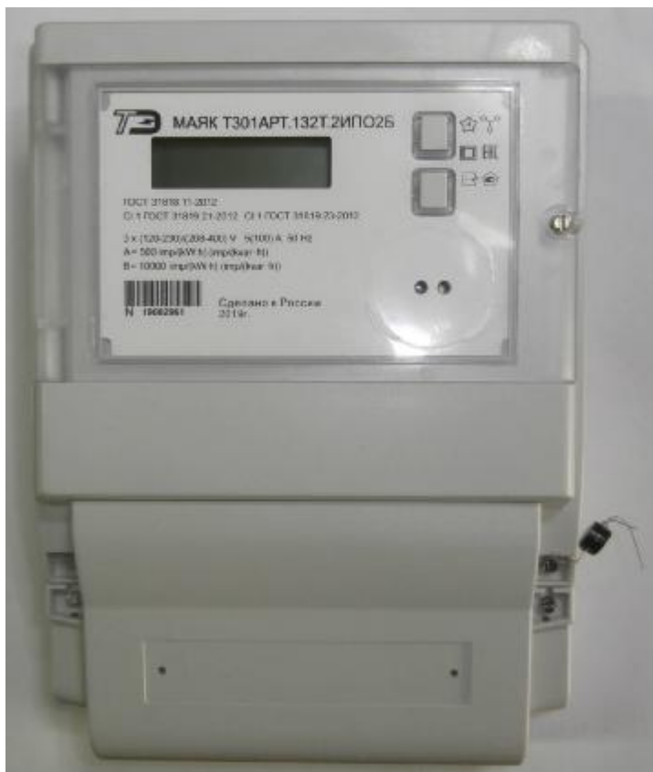
Рисунок 1 – Общий вид счетчика электрической энергии трехфазного статического МАЯК Т301АРТ