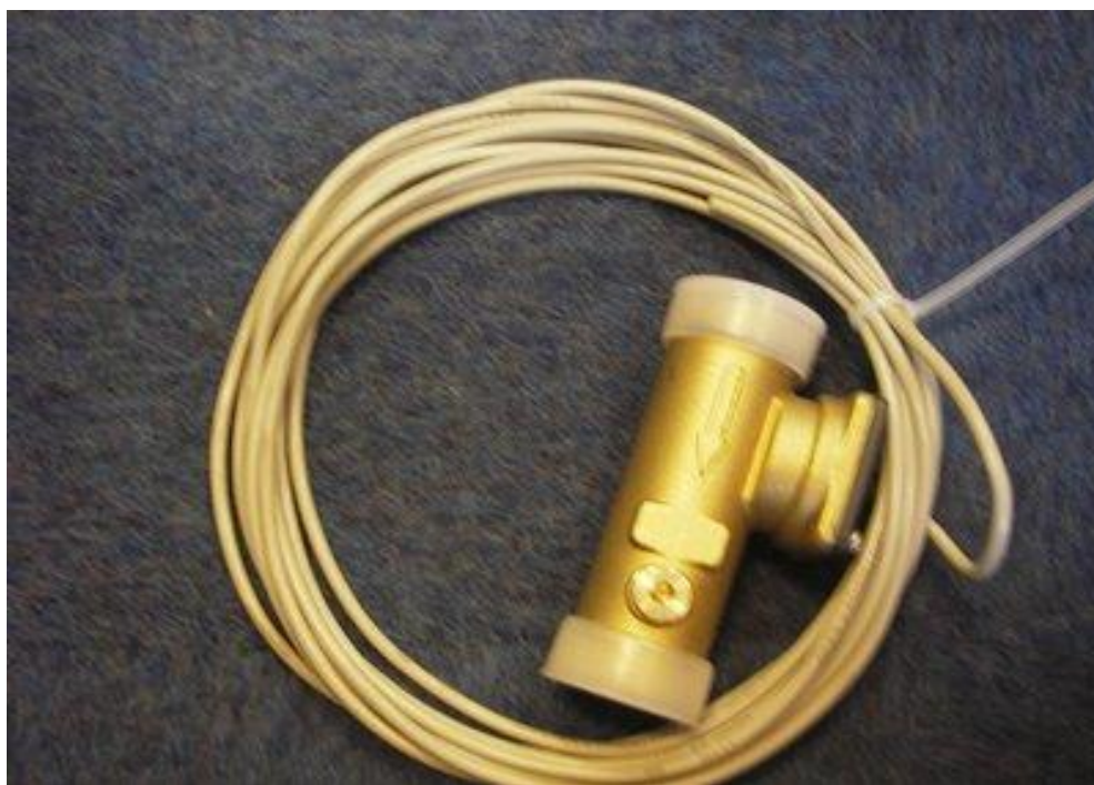
Рисунок 1 - Общий вид (фото) расходомера турбинного TURBODOS.

Общий вид и конструкция расходомера показаны на рисунках 1 и 2.