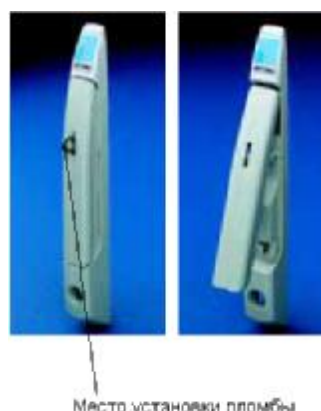
Рис. 2. Места установки пломб и нанесения оттисков клейм

Защита от несанкционированного доступа к ИВК ЭнергоКруг, обеспечивается путем закрепления компонентов на DIN-рейку в корпусе шкафа, который закрывается на ключ или пломбируется. Также в шкаф может ставиться датчик открытия дверцы, информация с которого записывается в протокол событий контроллера, Внешний вид датчика открытия дверцы приведен на рисунке 2.