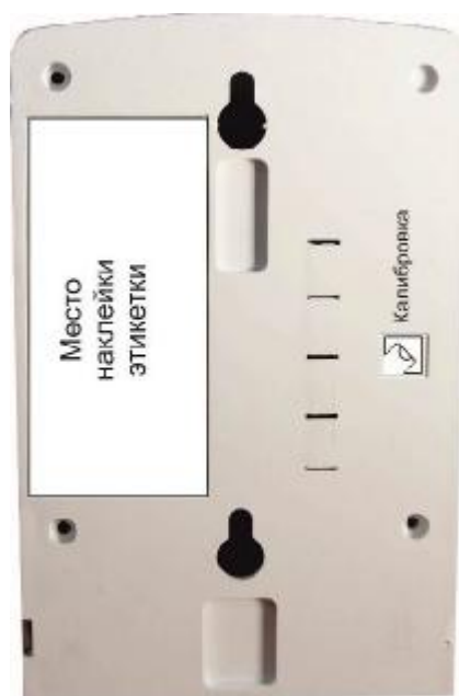
Рисунок 2 – Фотография мест для пломбирования сигнализатора загазованности природным газом СЗ-1Е.