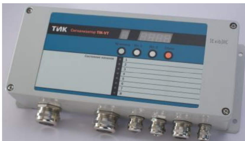
Рисунок 2 - Внешний вид блока сигнализации

Внешний вид блока сигнализации приведен на рисунке 2.