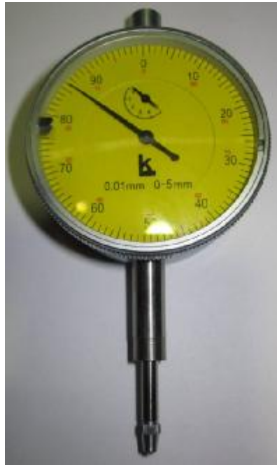
Рисунок 1 – Общий вид индикаторов ИЧ с желтым циферблатом и металлическим подвижным ободком.