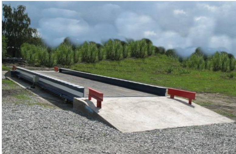
Рисунок 7 Общий вид весов автомобильных электронных ЭСВ-А