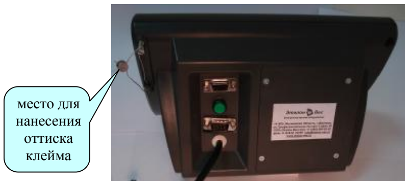
Рисунок 2 Схема защиты от несанкционированного доступа в настройке индикатора ВУ-2010 и обозначение места для нанесения оттиска клейма.