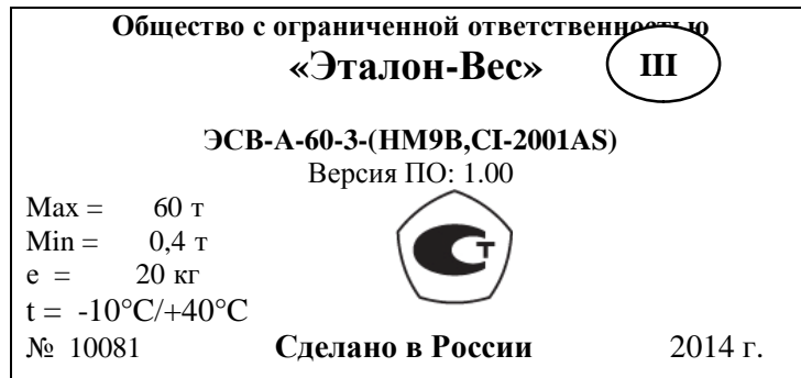
Рисунок 9 Маркировка весов на грузоприемном устройстве