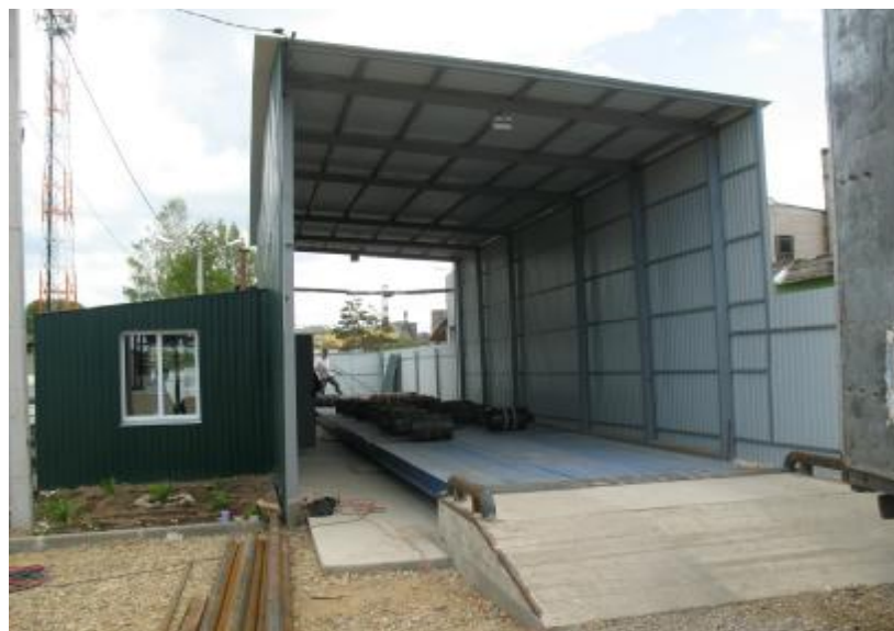
Рисунок 8 Общий вид весов автомобильных электронных ЭСВ-А