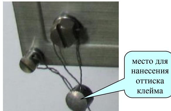
Рисунок 1 Схема защиты от несанкционированного доступа в настройки индикаторов CI-2001AS, CI-2001A и обозначение места для нанесения оттиска клейма.