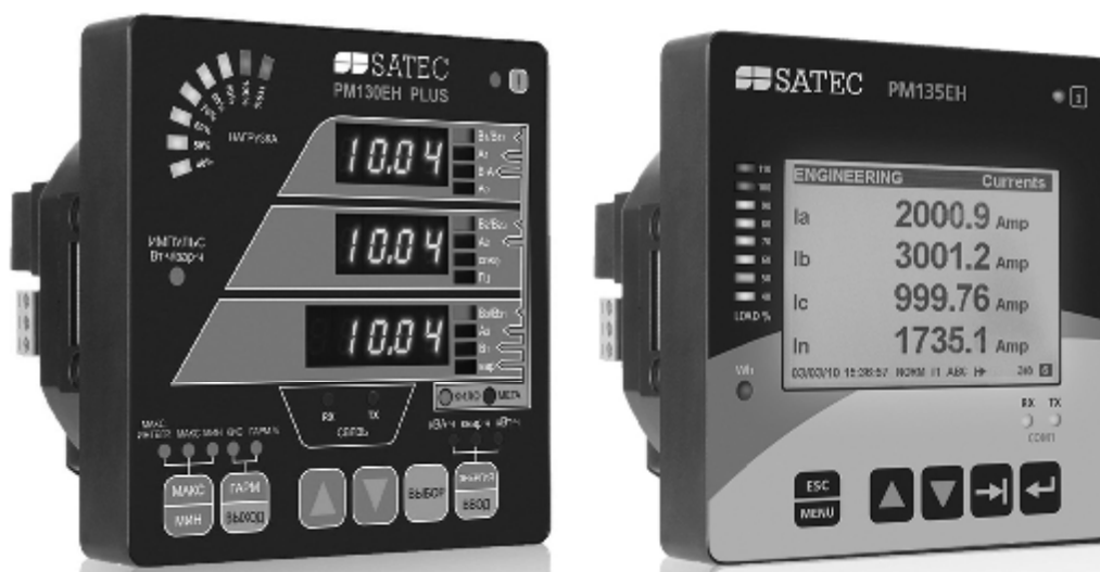
Рисунок 1 - Внешний вид измерителей модификаций PM130EH Plus и PM135EH

Конструктивно измерители выполнены в ударопрочном пылезащитном корпусе и представляют собой цифровые приборы, внешний вид которых представлен на рисунке 1.