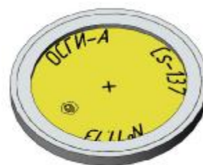
б – исполнения 01-К, 02-К