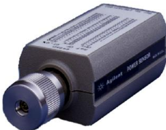
Рисунок 2 – Вид преобразователя измерительного 8485D