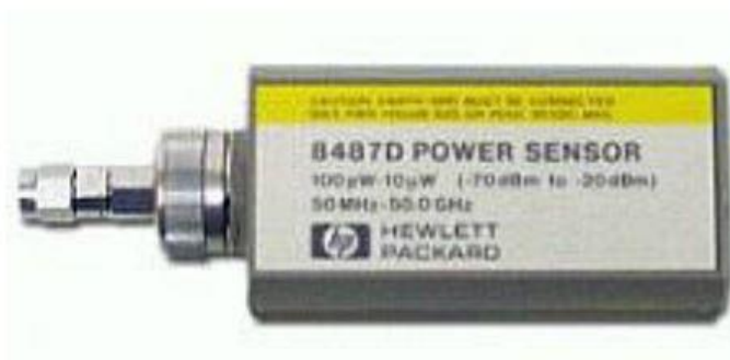
Рисунок 3 – Вид преобразователя измерительного 8487D