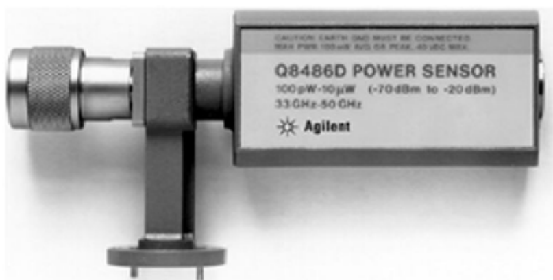
Рисунок 4 – Вид преобразователей измерительных Q8486D, R8486D, V8486A, W8486A

Преобразователи измерительные совместимы с блоками измерительными ваттметров поглощаемой мощности N1913A, N1914A.