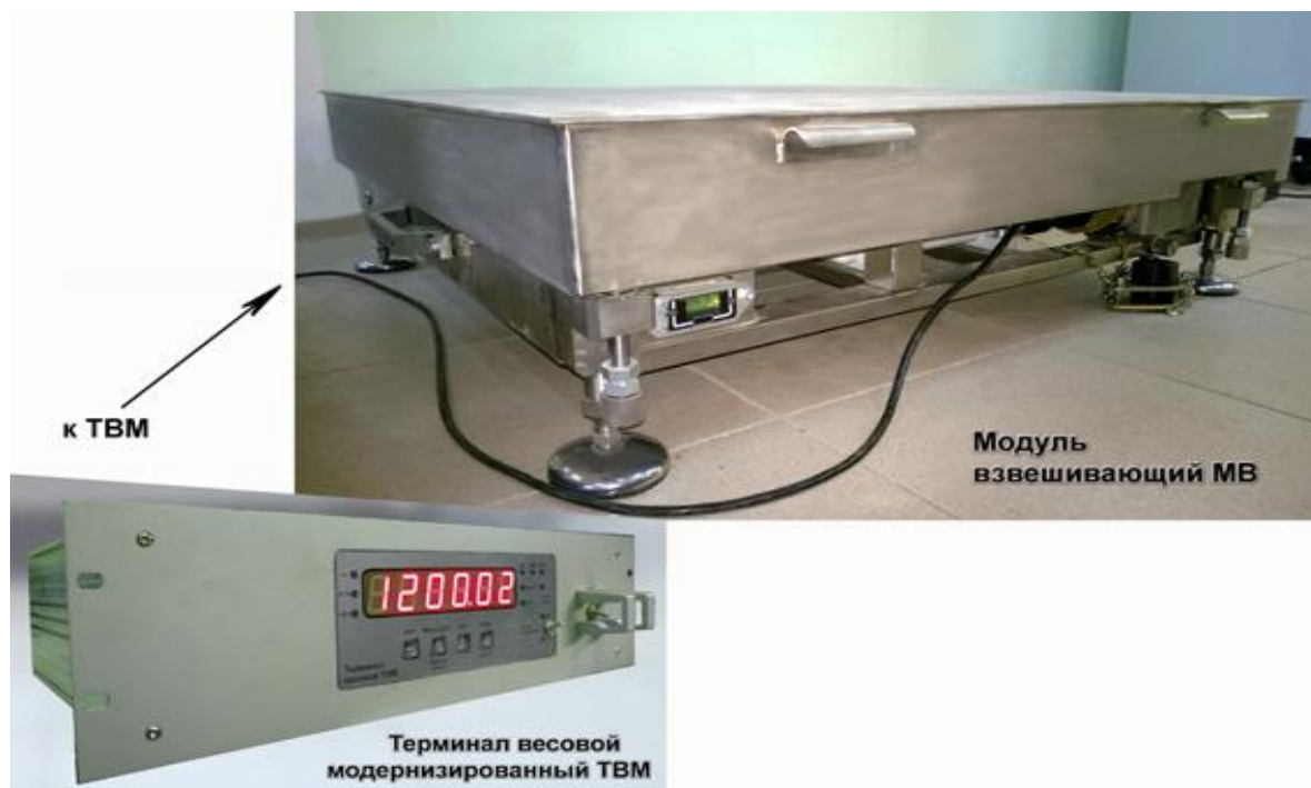
Рисунок 1 - Общий вид устройств весоизмерительных платформенных УВП

МВ представляет собой двухрамную прямоугольную конструкцию из нержавеющей стали. Между грузоприемной платформой МВ и опорной рамой смонтирован взрывозащищенный тензорезисторный датчик веса (ДТВ) типа “single-point”. Нагрузка от установленного на грузоприемную платформу ТЗК передается через ДТВ на опорную раму с четырьмя регулируемыми по высоте опорами. Грузоприемная платформа МВ закрыта съемной крышкой. Для предохранения от повреждения ДТВ при транспортировке МВ служат узлы