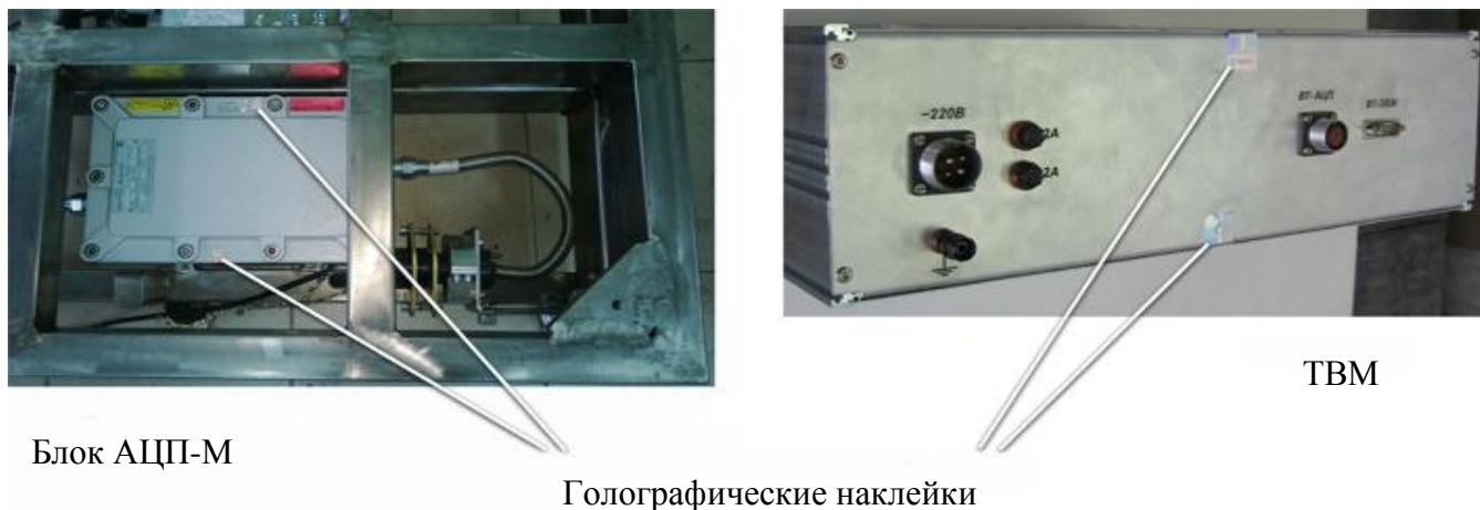
Рисунок 3 - Схема пломбировки ТВМ и блока АЦП-М

Схема пломбировки ТВМ и блока АЦП-М представлена на рисунке 3.