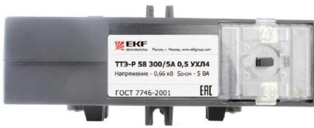
Рисунок 3. (Место пломбы или наклейки)