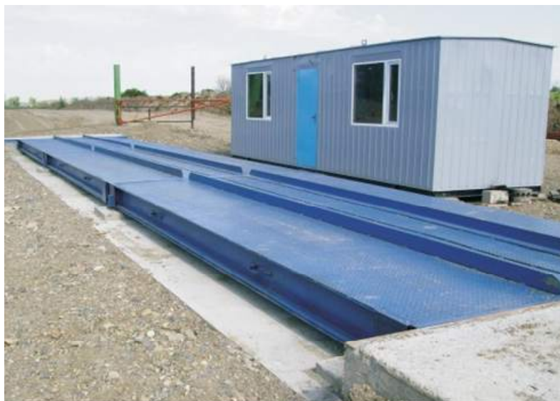
Рисунок 1 - Внешний вид весов автомобильных тензометрических ЭВА

Внешний вид весов автомобильных тензометрических ЭВА, датчиков весоизмерительных тензорезисторных и применяемых индикаторов представлены соответственно на рисунках 1, 2 и 3.