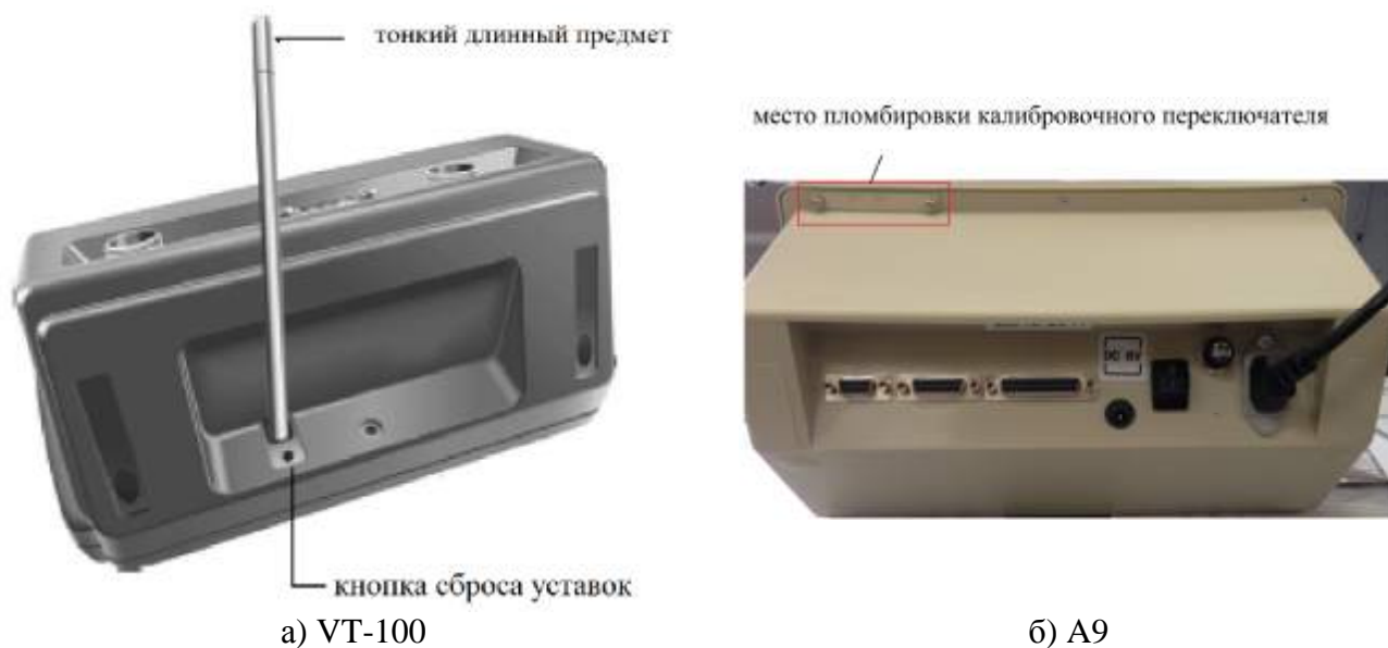
Рисунок 4 Схема пломбировки индикаторов

На задней стенке индикатора А9 расположена крышка, закрывающая доступ к специальной кнопке, отвечающей за доступ к меню «калибровка». Крышка крепится на двух винтах со специальными гнездами для пломбировки, винты переплетают между собой проволокой и ставится свинцовая пломба с оттиском клейма поверителя.