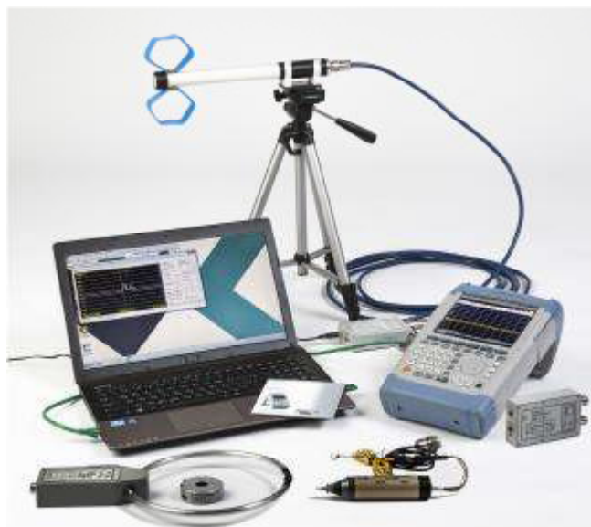
Рисунок 1 - Фотография общего вида системы