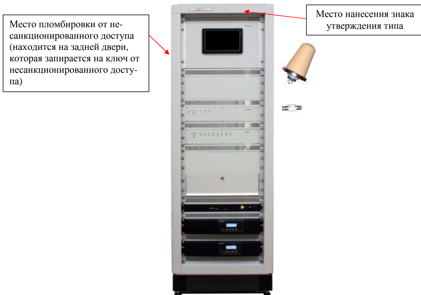
Рисунок 1 - Внешний вид СЕВ-СК 1 и схема пломбировки

Внешний вид СЕВ-СК 1 с указанием места нанесения знака утверждения типа и схема пломбировки от несанкционированного доступа приведены на рисунке 2.