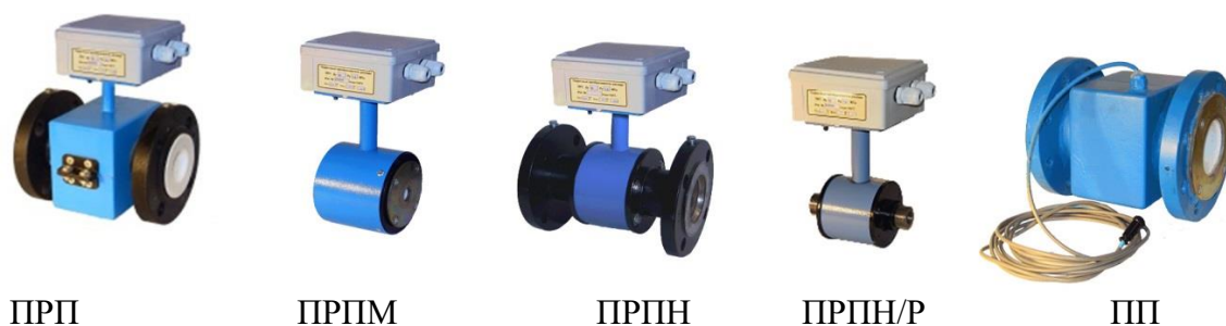
Рисунок 1. Внешний вид ППР

Типы и внешний вид ППР и ИВБ приведены на рисунках 1 и 2.