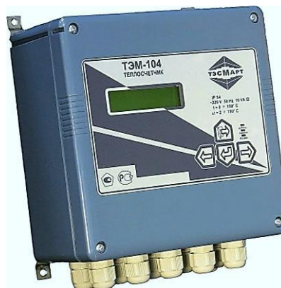
Рисунок 2. Внешний вид ИВБ

Типы ТС, ИП и ДИД применяемые в составе теплосчетчика, указаны в Таблицах 1, 2, 3.