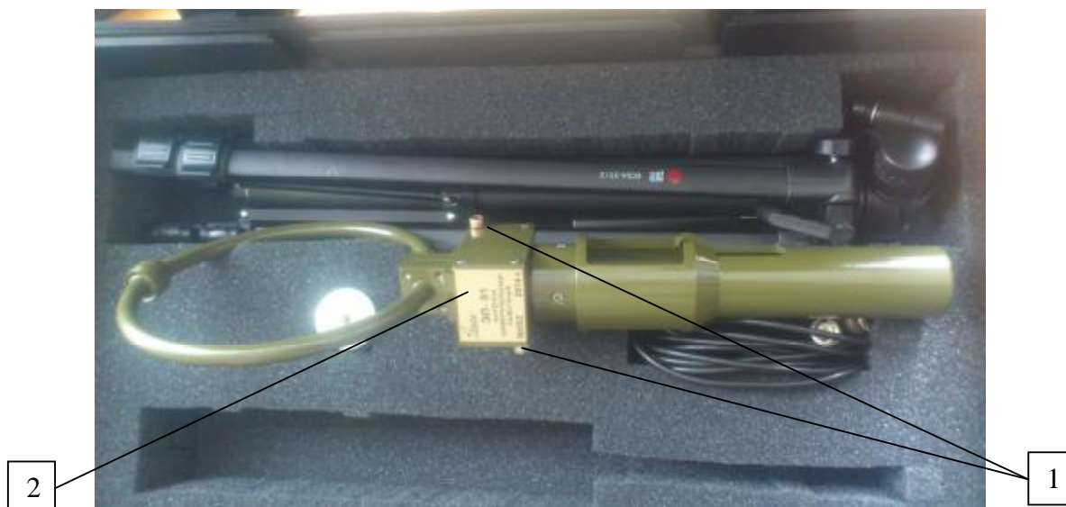
1 – место пломбирования 2 – место знака утверждения типа