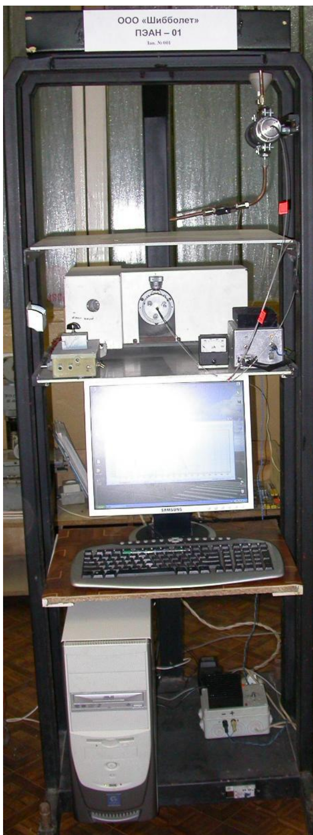
Рис. 1 Фотография внешнего вида анализатора ПЭАН - 01