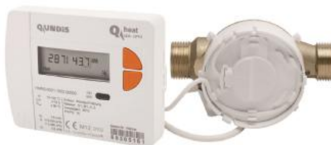
Фото 4. Теплосчетчик Q heat QDS в моноблочном исполнении со съёмным вычислителем