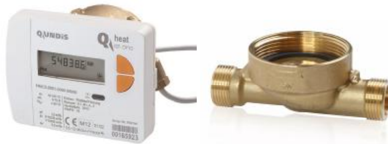
Фото 1. Теплосчетчик Q heat IST в капсульном исполнении с EAT элементом

Общий вид теплосчетчика Q heat представлен на фото 1-4.