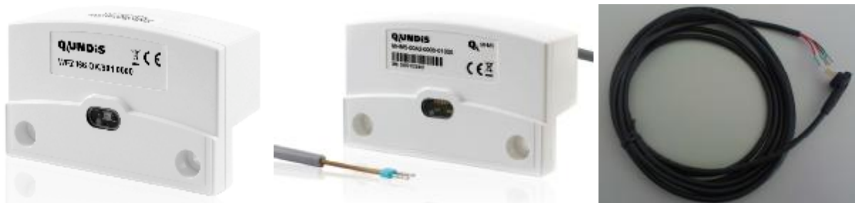
Фото 5. Интерфейсные модули Q module (радиомодуль, M-Bus модуль, M-Bus / импульсный кабель)

Интерфейсные модули Q module представлены на фото 5.