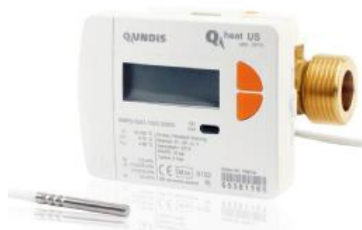
Фото 3. Теплосчетчик Q heat US QDS в моноблочном исполнении с ультразвуковым датчиком расхода