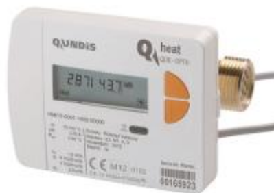
Фото 2. Теплосчетчик Q heat QDS в моноблочном исполнении