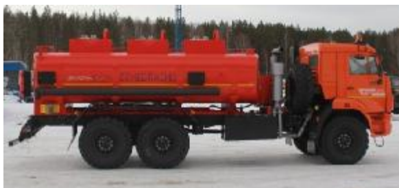
Рисунок 3 – АТЗ с тремя секциями