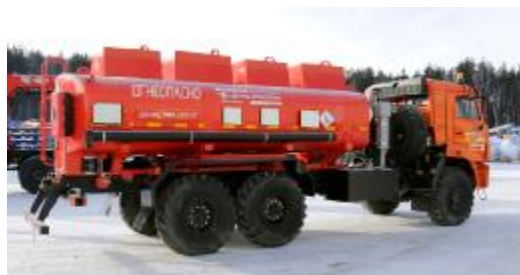
Рисунок 4 – АТЗ с четырьмя секциями