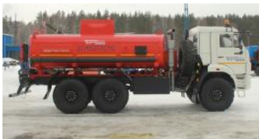
Рисунок 1 – АТЗ с одной секцией

Внешний вид АТЗ представлен на рисунке 1, 2, 3, 4. Место пломбирования обозначено на рисунке 5, 6 и 7.