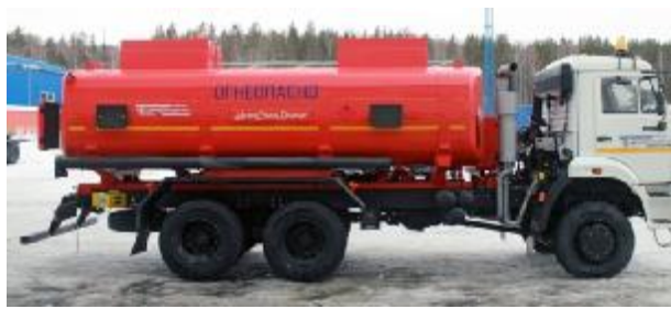
Рисунок 2 – АТЗ с двумя секциями