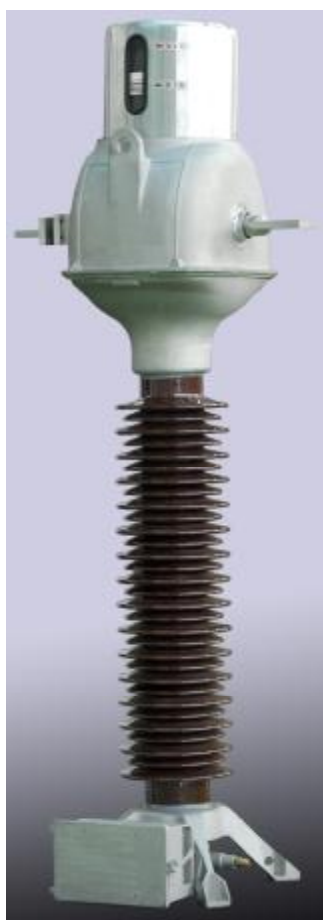
Рис. 2. Трансформатор тока ТФМ-110