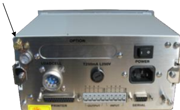
Индикатор CAS CI-5200A