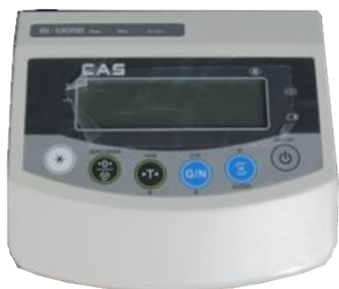
Индикатор CAS NT-200A