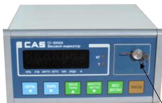
Индикатор CAS CI-6000A