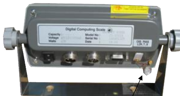
Индикатор CAS CI-2001A