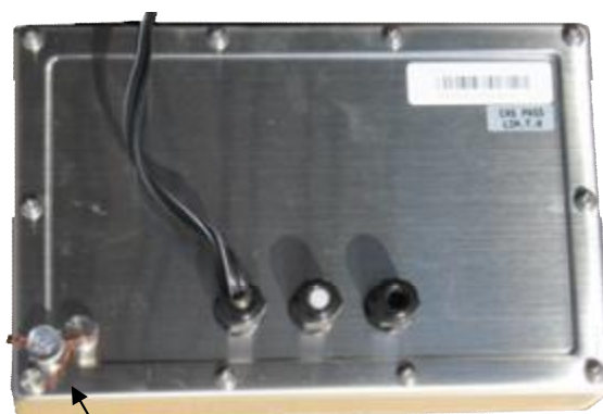
Индикатор CAS CI-2400BS