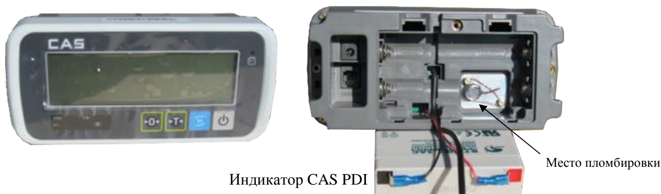
Рисунок 2 – Место пломбировки весов