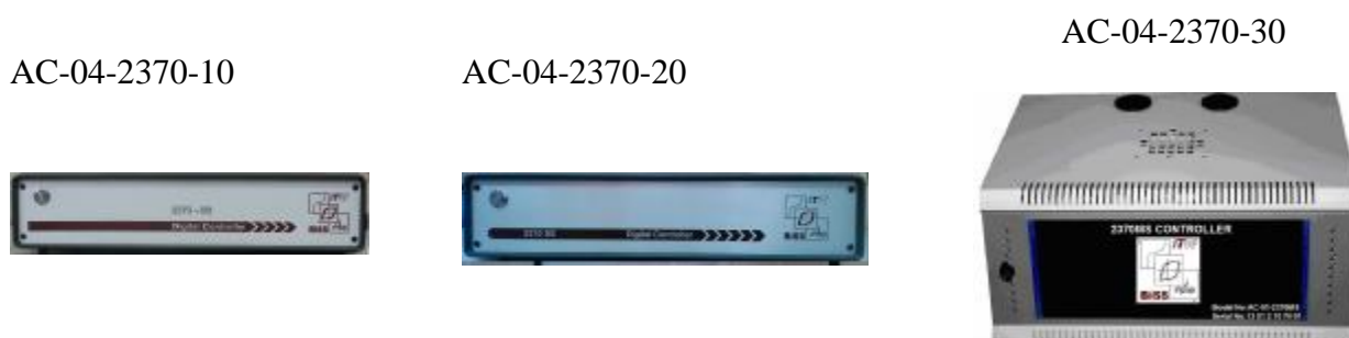
Рисунок 1 Фотография общего вида усилителей измерительных

Общий вид усилителей представлен на рисунке 1.