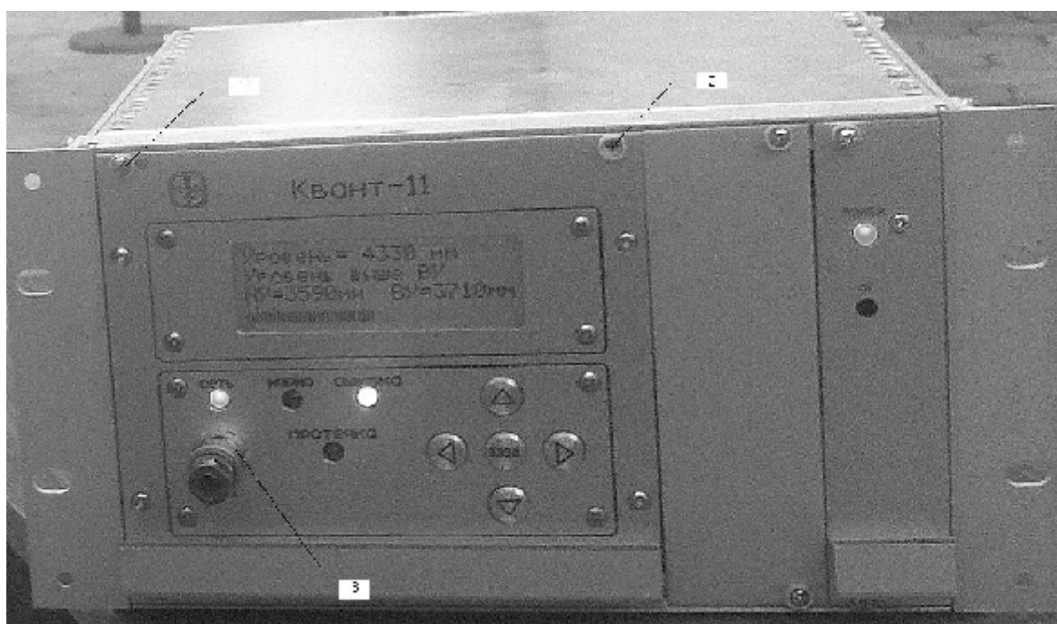
Рис.2. Электронный преобразователь уровнемера натрия Квант-11 (1, 2 - места установки пломб на винты; 3 - места установки пломбы на розетку)