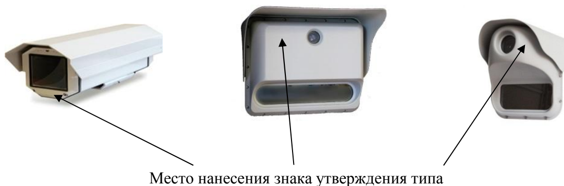
Рисунок 1 - Внешний вид видеомодулей

Внешний вид составных частей комплексов и обозначение места для размещения знака утверждения типа представлены на рисунках 1 и 2. Комплекс пломбируется специальной пломбой, разрушающейся при попытке удаления.