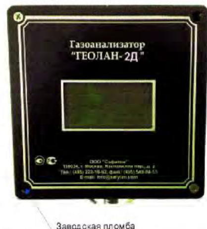
Рис. 4 Газоанализатор «Геолан-2Д»

Газоанализаторы позволяют одновременно принимать и обрабатывать измерительную информацию с 16 сенсоров. Встроенный цифровой жидкокристаллический индикатор служит для визуального контроля концентрации измеряемых веществ.