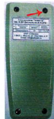
Рис. 1 Газоанализатор «Геолан-1Д»