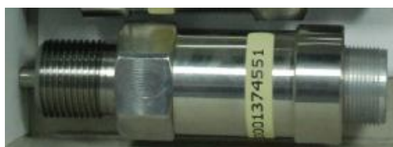
Преобразователь давления ДД-И-1,00-05