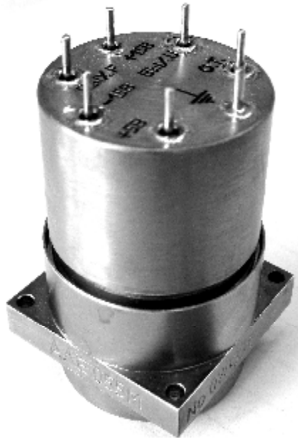
Рисунок 1 – Общий вид акселерометра