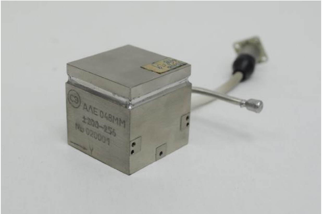
Рисунок 1 – Общий вид акселерометра