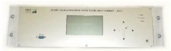
Рисунок 5 – Электронный блок трансформаторов (вид спереди)