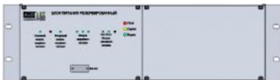
Рисунок 8 – Электронный блок резервированного блока питания повышенной надежности (вид спереди)