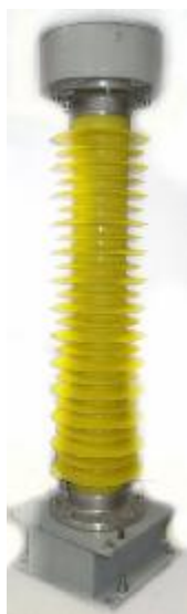
Рисунок 2 – высоковольтный емкостной делитель ДНЕЭ-110