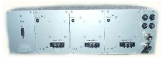
Рисунок 7 – Электронный блок ЦАП Н для вывода пропорционального аналогового сигнала 100/\sqrt{3} В трансформаторов вид сзади