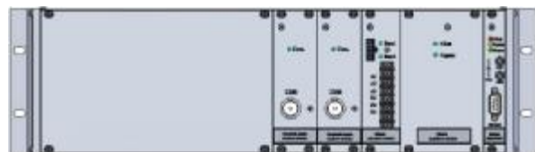
Рисунок 9 – Электронный блок резервированного блока питания повышенной надежности (вид сзади)

Условное обозначение трансформаторов представлено в таблице 1.