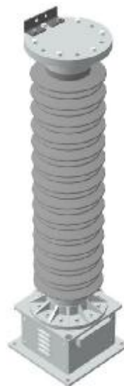
Рисунок 3 – высоковольтный емкостной делитель с встроенным в изолятор компенсатором температурного расширения ДНЕЭ-110ВК