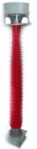
Рисунок 4 – высоковольтный емкостной делитель ДНЕЭ-220