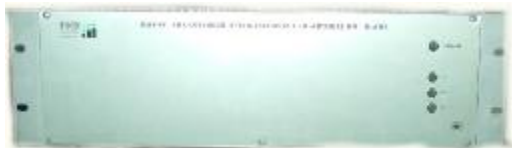
Рисунок 6 – Электронный блок ЦАП Н для вывода пропорционального аналогового сигнала 100/\sqrt{3} В трансформаторов