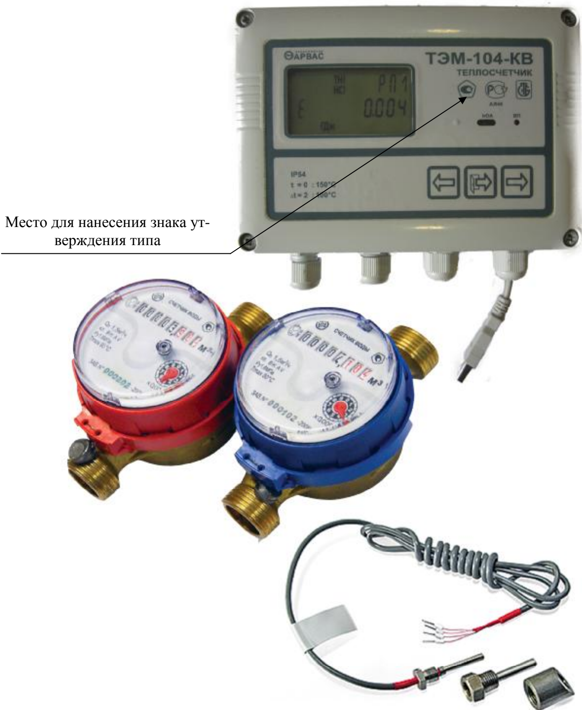
Рисунок 1 – Внешний вид теплосчетчика ТЭМ-104-КВ

Внешний вид теплосчетчика ТЭМ-104-КВ приведен на рисунке 1.