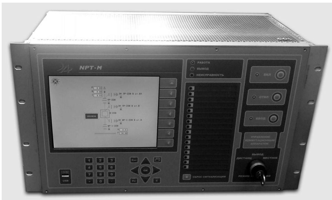
Рисунок 1 - Внешний вид контроллера (вид со стороны передней панели, в зависимости от кода заказа внешний вид передней панели может изменяться).