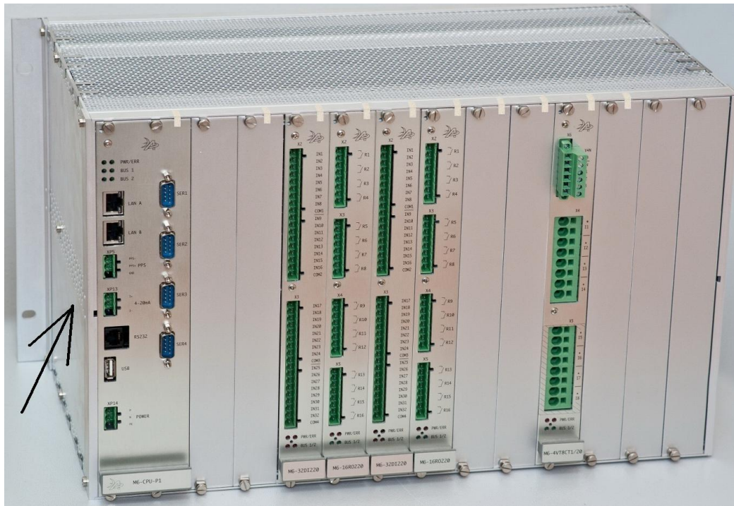
Рисунок 2 - Внешний вид контроллера на 14 слотов (вид со стороны установки модулей, в зависимости от кода заказа внешний вид контроллера может изменяться). Стрелкой показано место нанесения знака утверждения типа