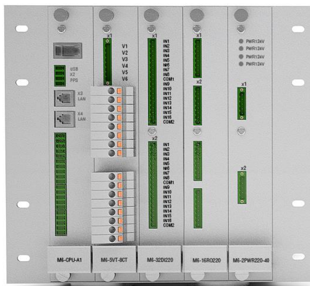
Рисунок 4 - Внешний вид контроллера на 5 слотов (вид со стороны установки модулей, в зависимости от кода заказа внешний вид контроллера может изменяться). Место нанесения знака утверждения типа аналогично предыдущим вариантам