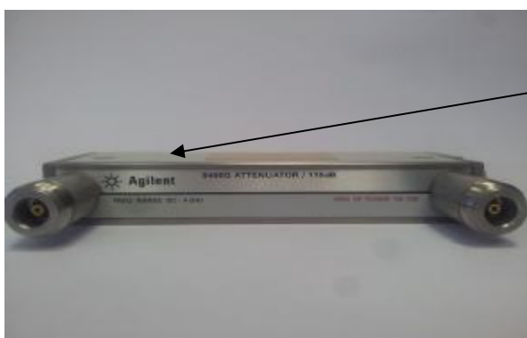
Рисунок 1. Общий вид аттенюатора 8494G